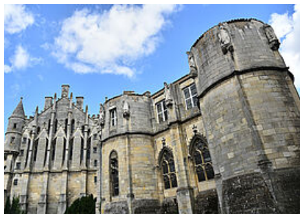
Palais des ducs d'Aquitaine

Résidence des comtes de Poitou - ducs d'Aquitaine, le Palais est l'un des plus remarquables ensembles d'architecture civile médiévale en France. La grande salle, à la fois lieu de vie, de fêtes et de justice, est construite vers 1200 sous le règne d'Aliénor d'Aquitaine. Au XIVe siècle, elle est agrémentée par Jean de Berry de cheminées richement ouvragées et de larges baies. La tour Maubergeon, construite au XIIIe est, elle aussi, remaniée à la même période : l'ancien donjon défensif cède la place à un palais résidentiel, aux vastes fenêtres gothiques et surmonté de statues. Devenu Palais de Justice à la Révolution française jusqu'en 2019, le Palais est pour la première fois offert aux visiteurs à l'occasion de Traversées / Kimsooja.