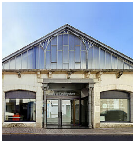
Maison de l'architecture