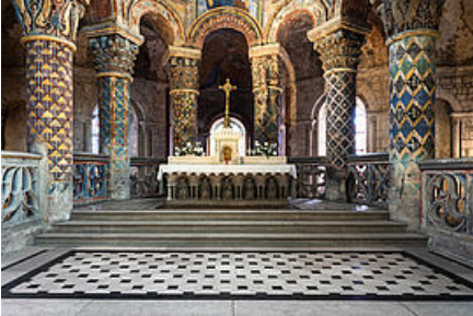
Eglise Sainte-Radegonde

Reine des Francs, Radegonde fonde à Poitiers vers 555 le monastère Sainte-Croix, premier monastère féminin en Gaule. A sa mort en 587, elle est inhumée dans l'église Sainte-Marie-hors-les-Murs, qu'elle venait de faire construire non loin de son monastère. L'église prend alors le vocable de « Sainte-Radegonde ».