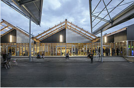
Confort Moderne

Lieu incontournable de la scène contemporaine, le Confort Moderne est un établissement culturel emblématique de Poitiers.