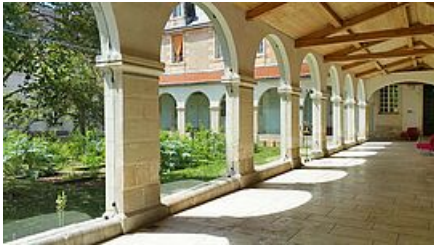
Canopé cloître

Du XIIe au XVIIe siècles, l'abbaye Saint-Hilaire-de-la-Celle de Poitiers est occupée par les Augustins. Si les bâtiments conventuels ont été reconstruits à partir du XVIIe siècle, la chapelle conserve des éléments sculptés du XIIe. La coupole nervée sur trompe de la croisée du transept est un bel exemple du style gothique angevin. Acquis par l'Education Nationale dans les années 1950, le site accueille aujourd'hui l'Atelier Canopé 86-Poitiers, lieu de formation, d'expérimentation et d'animation pour la communauté éducative.